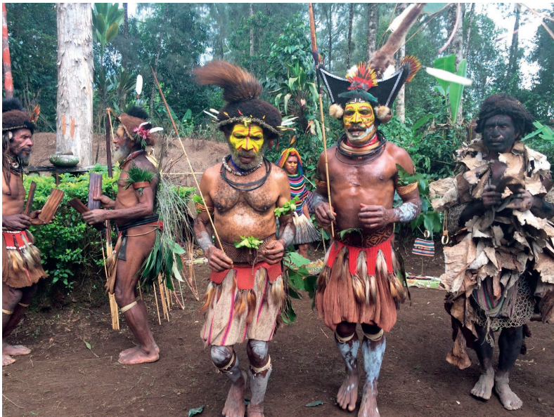
oben: Holzschwein / unten: Moka-Zeremonie